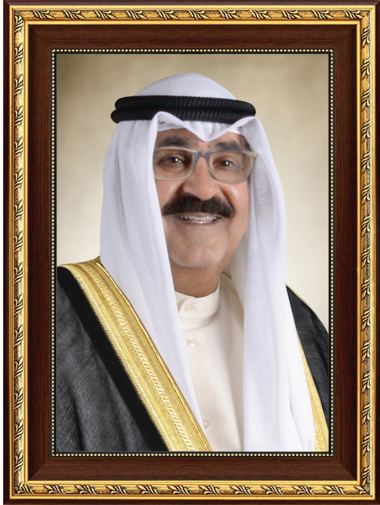
سمو الشيخ مشعل الأحمد الجابر الصباح ولي عهد دولة الكويت

H.H. Sheikh Meshal AL-Ahmad Al-Jaber Al-Sabah The Crown Prince Of The State Of Kuwait