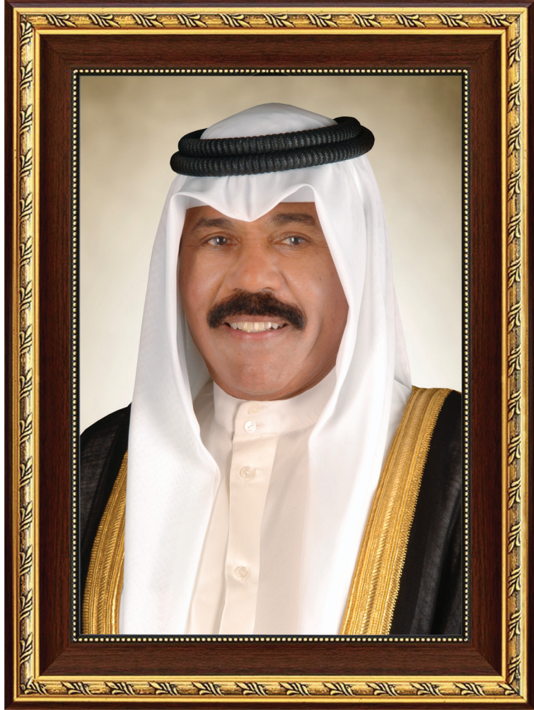
حضرة صاحب السمو الشيخ نواف الأحمد الجابر الصباح أمير دولة الكويت

H.H. Sheikh Nawaf AL-Ahmad Al-Jaber Al-Sabah The Amir Of The State Of Kuwait